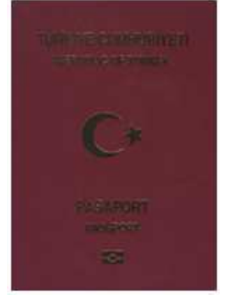
Umuma Mahsus Pasaport

Hizmet, hususi veya diplomatik pasaport başvurusu için 5682 sayılı Pasaport Kanunu'nda belirtilen şartları taşımayan kişiler umuma mahsus pasaport başvurusunda bulunabilirler.